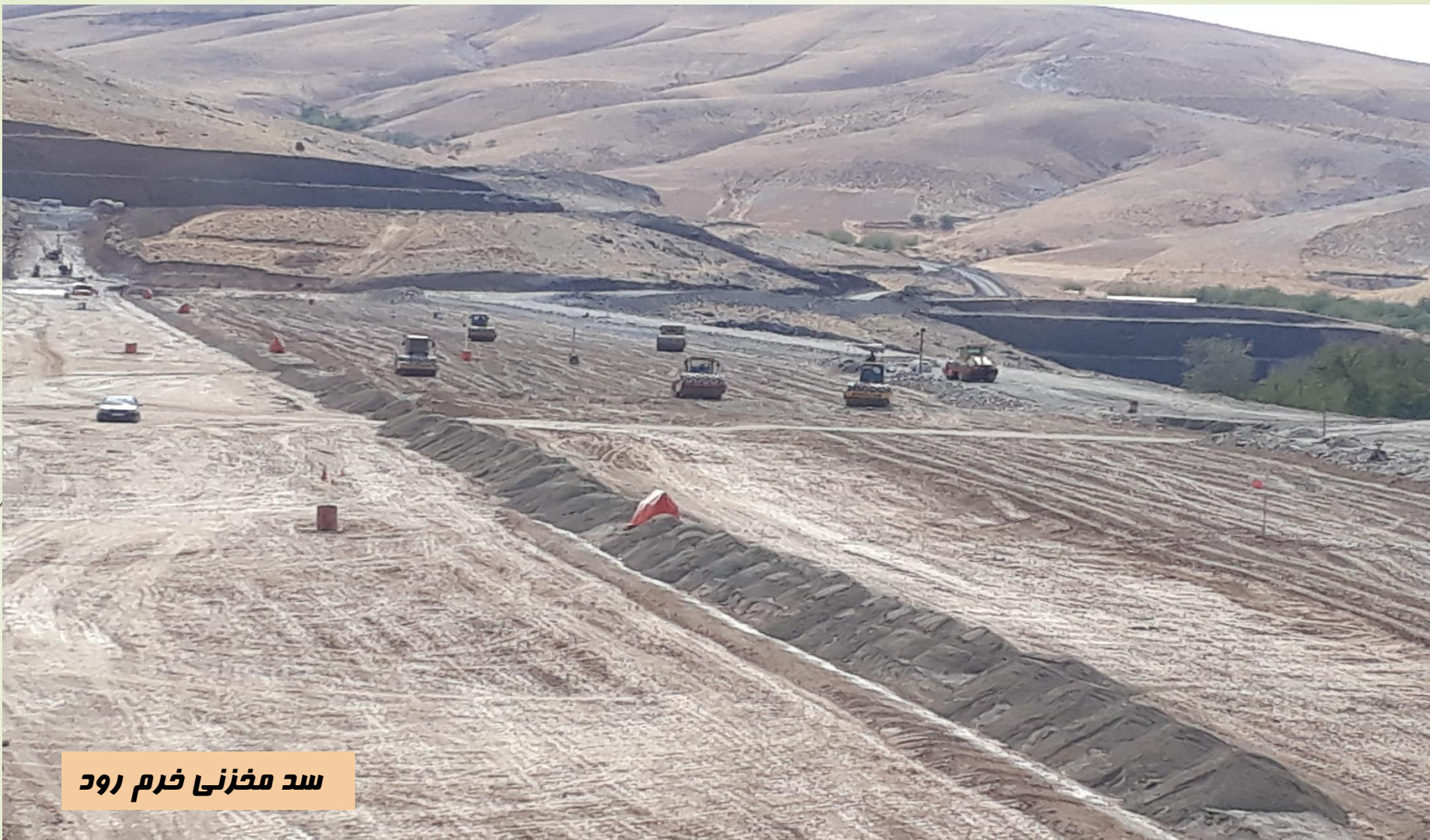
سد مخزنی خرم رود