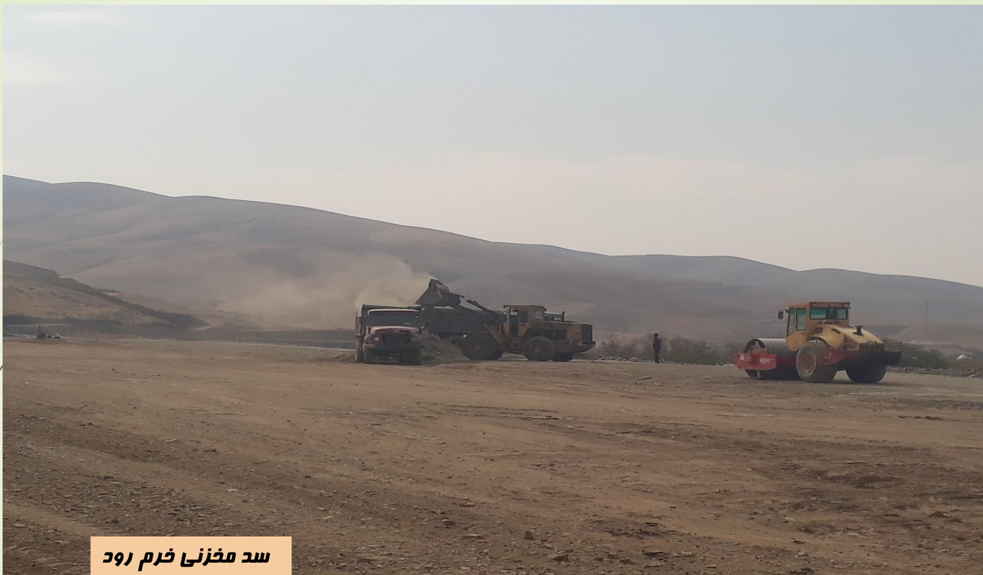
سد مخزنی خرم رود