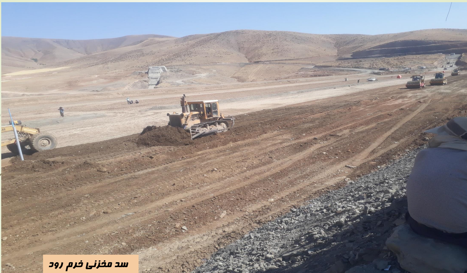
سد مخزنی خرم رود

تسطیح مصالح پوسته پایین دست با استفاده از بلدوزر D6