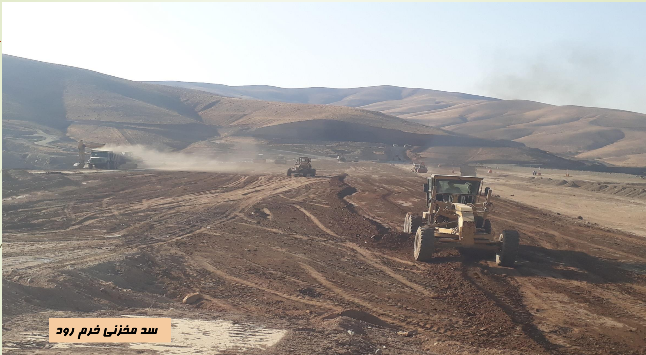
سد مخزنی خرم رود

پخش و تسطیح مصالح بار اندازی شده در بدنه