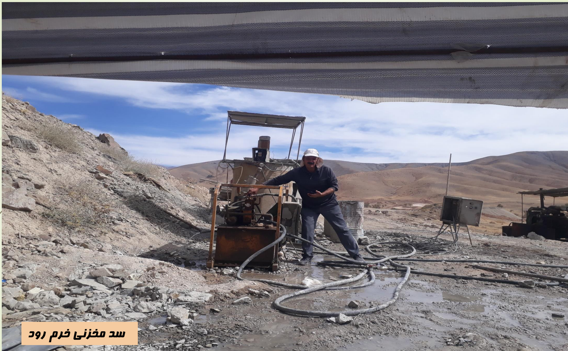
سد مخزنی خرم رود