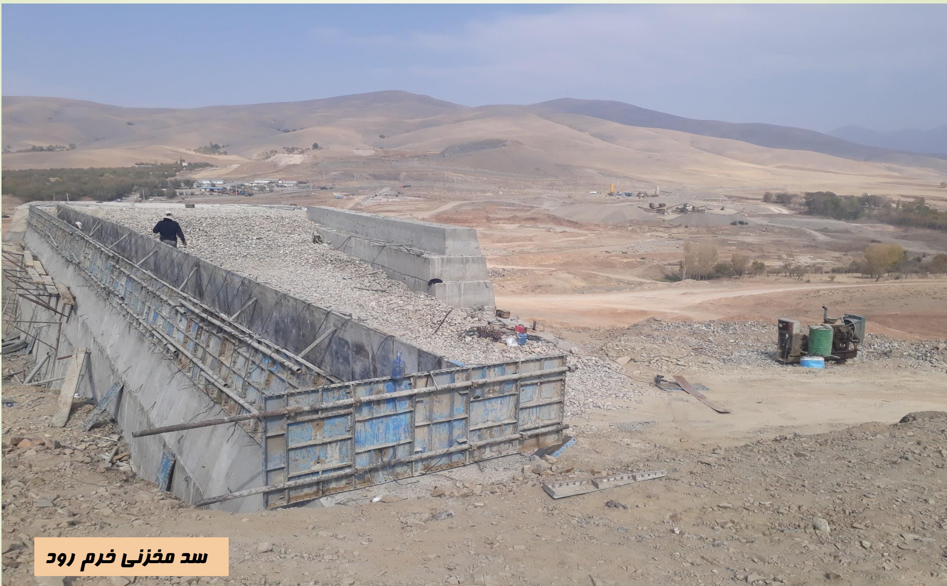
سد مخزنی خرم رود