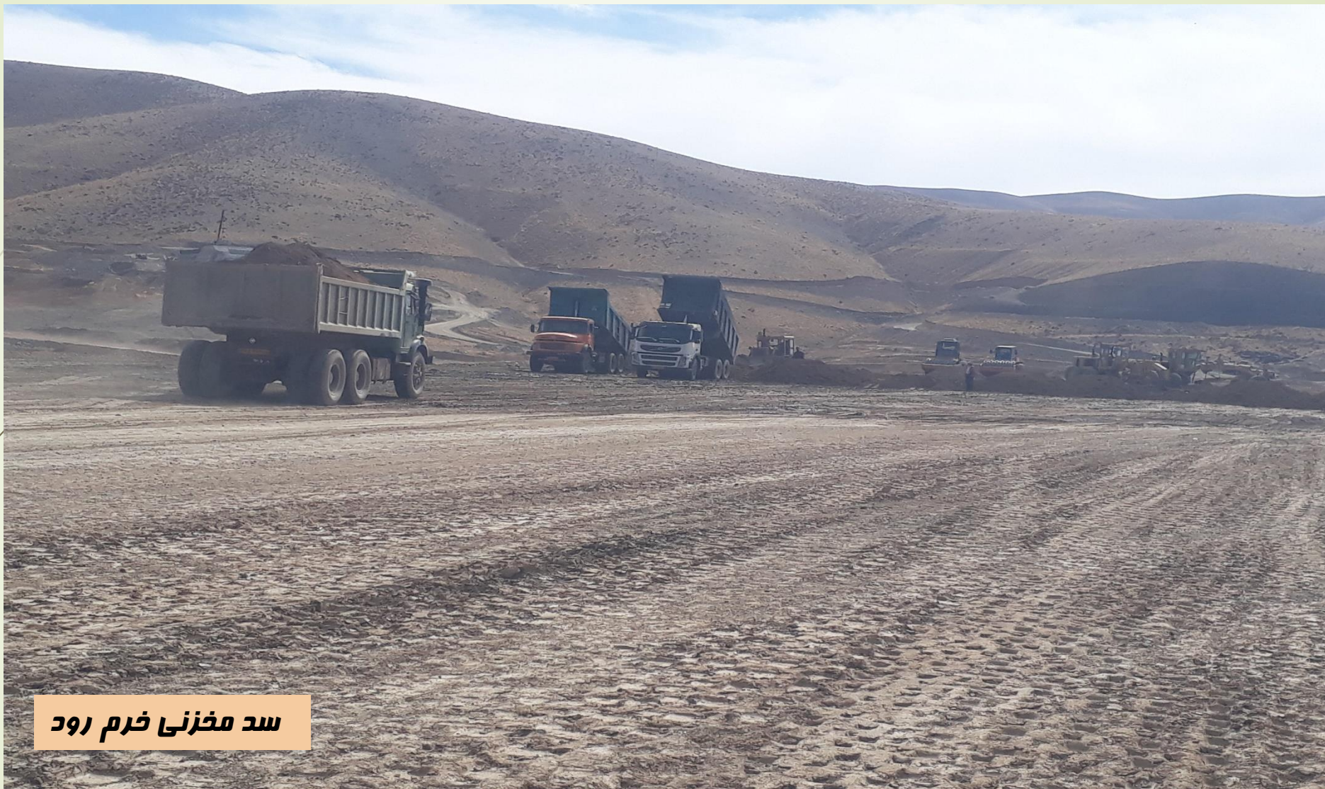
سد مخزنی خرم رود