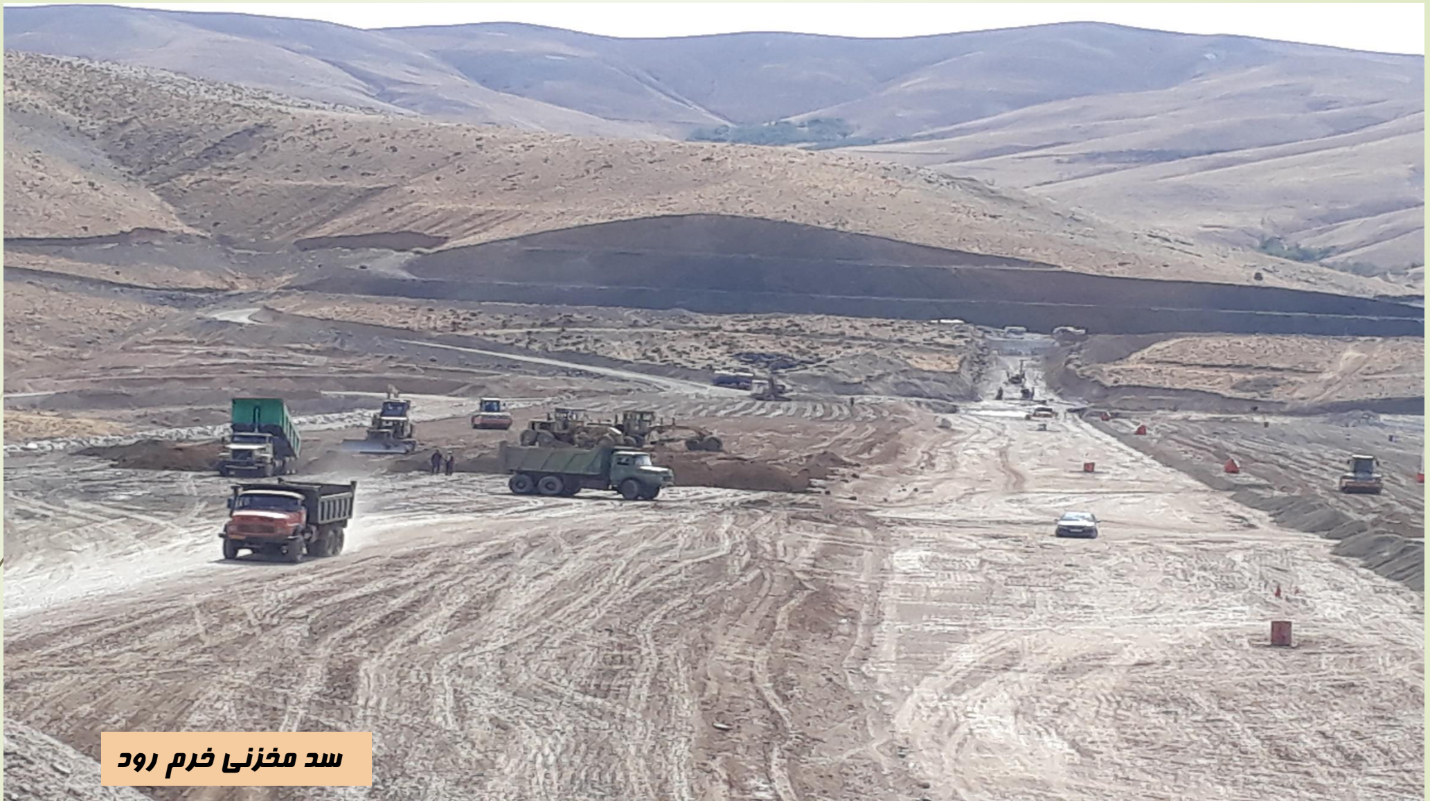
سد مخزنی خرم رود