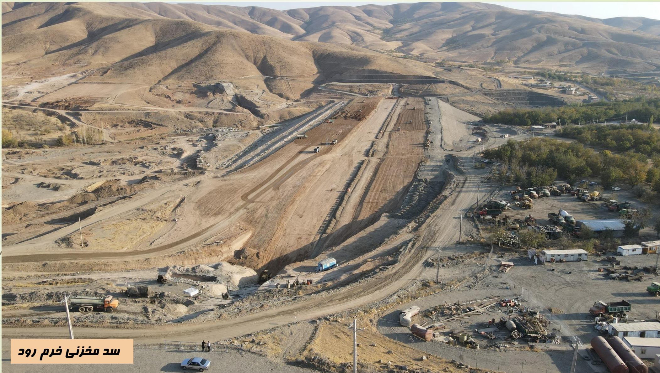
سد مخزنی خرم رود