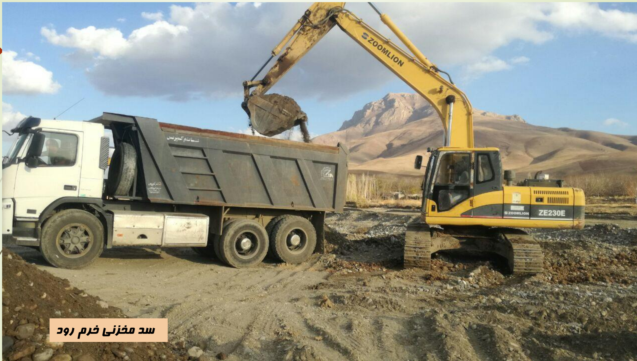
سد مخزنی خرم رود