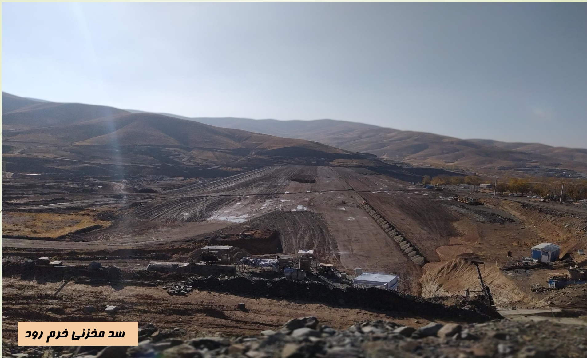
سد مخزنی خرم رود