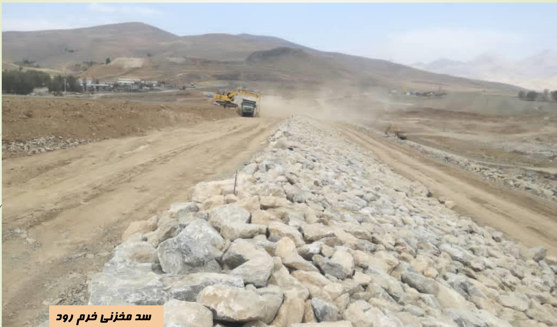
سد مخزنی خرم رود